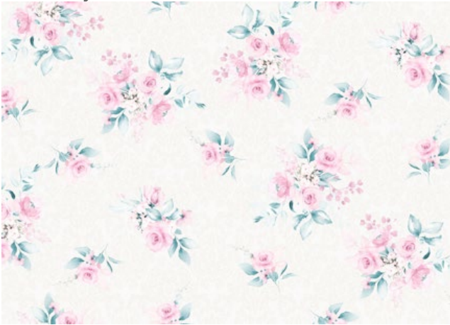
Name: My first rose