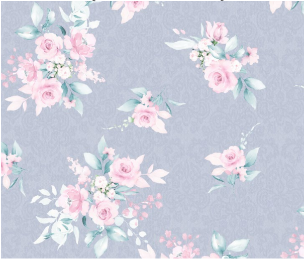
Name: Country roses on chambrey